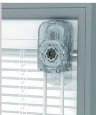
Comando a corda