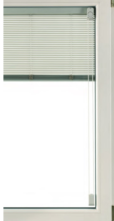
Veneziana interno vetro

Nel sistema ScreenLine® una tenda (veneziana, plissé o rullo) viene collocata tra due lastre di vetro, in una struttura vetrocamera. La movimentazione della tenda, sia essa manuale o elettrica, non altera le proprietà isolanti della vetrocamera e avviene in un ambiente totalmente sigillato. Le caratteristiche ScreenLine® garantiscono assoluta protezione da sporco, polvere e agenti atmosferici, dunque non richiedono manutenzione. La durata dei comandi magnetici utilizzati è pressoché eterna: smagnetizzazione pari al 2% ogni 100 anni.