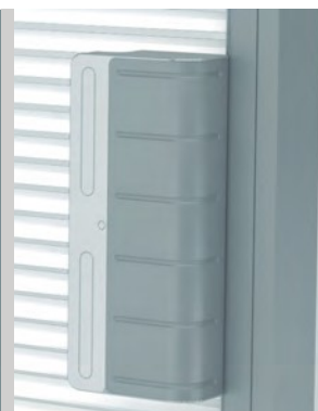
Modulo batteria Comando motorizzato