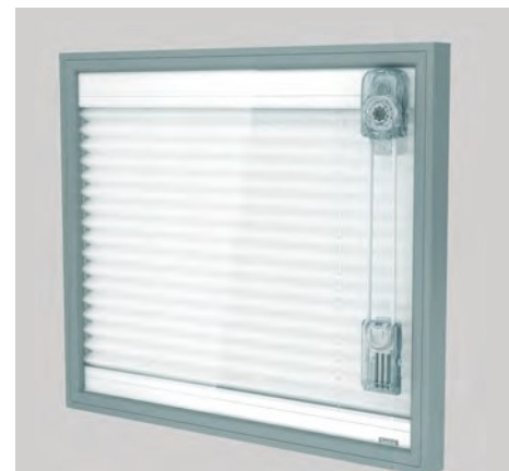
Tenda Plissé interno vetro